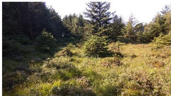
I sør er det en myr med noe lavere løpbarhet.

Her må en holde tunga beint på kartet og kompasset i angrepsstilling... og ikke minst...SJEKKE KODER. Postene ligger uanstendig tett.