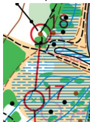
Løp fra post 17 til 18...SNU Kartet